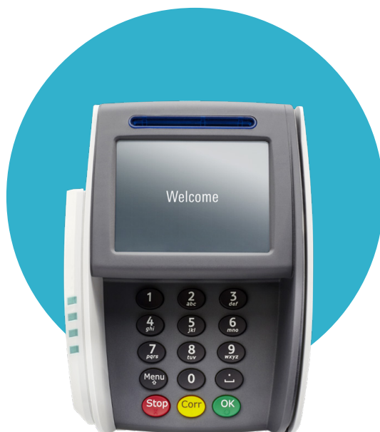
YOMANI TOUCH XR